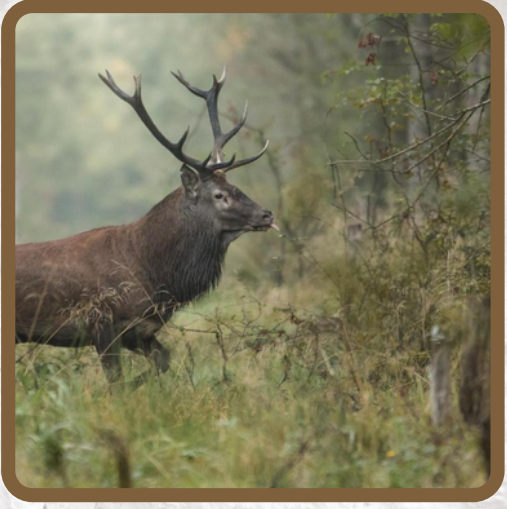
Sur cette quatrième image nous observons un énorme cerf, je l'ai choisie en rappel au cerf de l'accident que Mikey et Henna ont subi et le cerf que Jared a essayé de sauver quand il était dans le chalet après le bal.