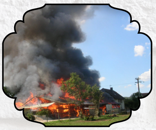
C'est une maison en feu ,correspondant au lycée qui est enflammé a la fin du roman au moment de la remise des diplomes par les indies kids.