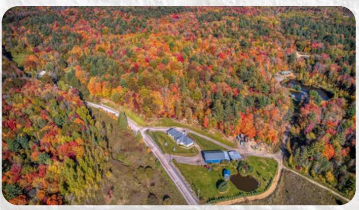
Ma première image correspond au lieu de vie des personnages. "Nous habitons une banlieue d'une balieue [...] une collosse montagne qui bouche l'horizon"