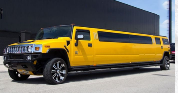
L'image représente une limousine Hummer jaune, qui a emmené les personnages à leur bal de promo. Je l'ai choisie car c'est un des moments qui m'a fait rire. Ils se sont fait bien avoir .