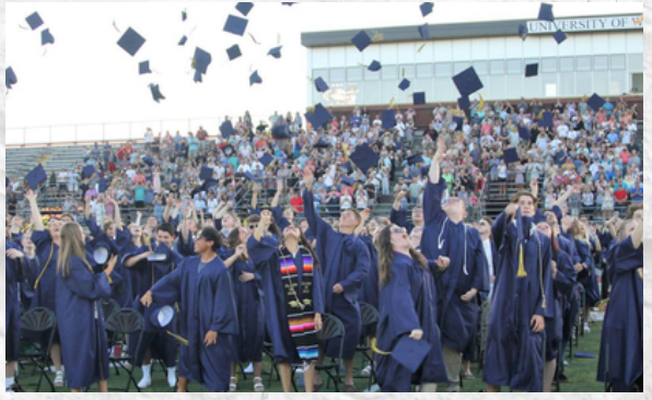
On peut clairement voir sur cette dernière image qu'il s'agit de la remise des diplômes, je l'ai mise car c'est un moment important et très fort. Cela signifie la fin du lycée et le départ de chacun pour son futur