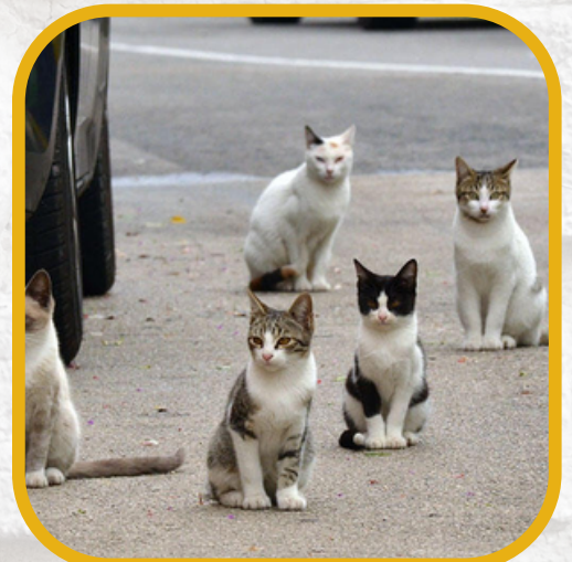
On peut voir sur cette image une troupe de chats, je l'ai choisie pour faire ressortir les pouvoirs de Jared, car il est un quart de dieu et attire les felins.