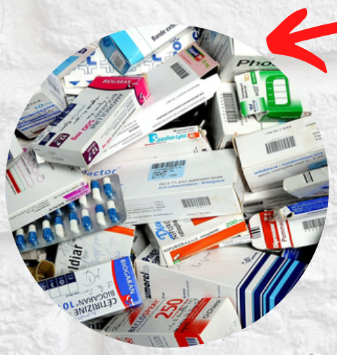
Sur l'image on peut apercevoir une grosse pile de médicaments, je voulais illustrer ça par rapport à tous les médicaments que Mikey prends pour sortir de son anxiété et que Mel prend pour sob anorexi( tout le monde ).